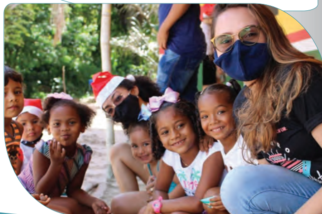
7ª edição do Natal Solidário na Vila Cruzeirinho, comunidade Guajará Mirim, Baixo Acaraí/PA.

Cada área possui um(a) gerente/líder que é o(a) responsável pela distribuição das tarefas entre os voluntários, pelo acompanhamento de sua execução e por apresentar relatório avaliativo após sua conclusão.