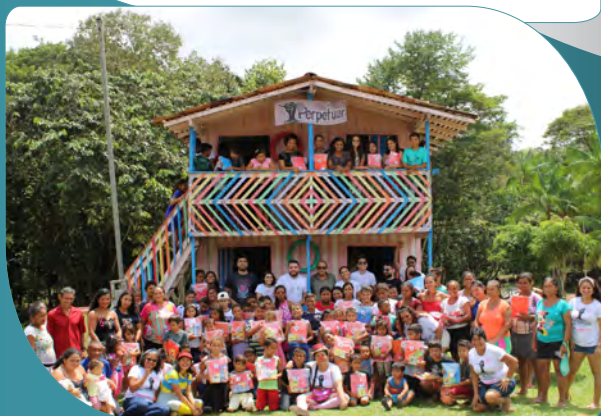
Doação de kits escolares para a Vila Jacundaí, Moju.

Somos um projeto voluntário que reúne profissionais e estudantes de nível superior com o objetivo de realizar ações de prevenção à violência sexual infantojuvenil e de estímulo à educação infantil a partir da distribuição de kits escolares.